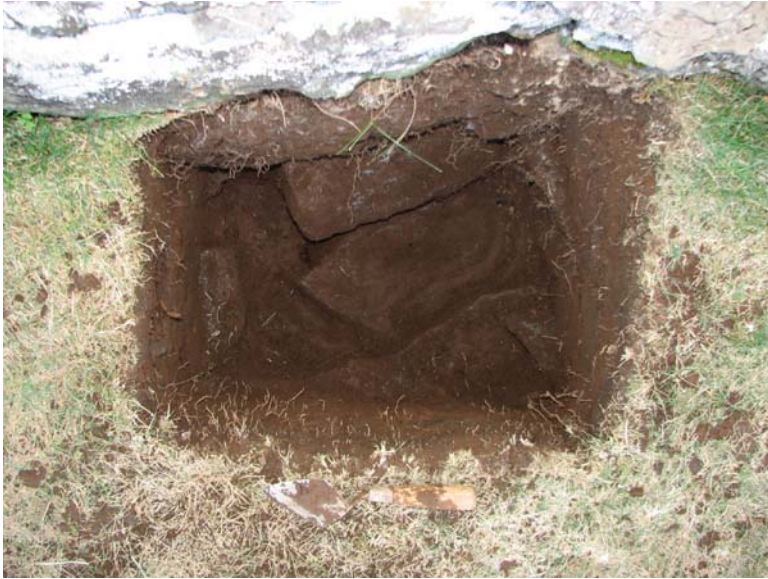
Test Pit 1 Camera direction; Vertical/South