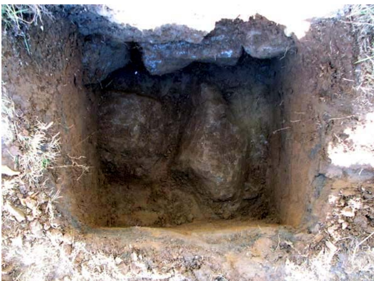
Test Pit 3 Camera direction Vertical/East