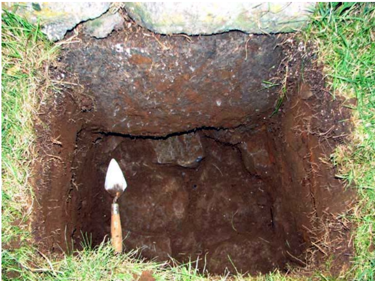
Test Pit 2 Camera direction; Vertical/West