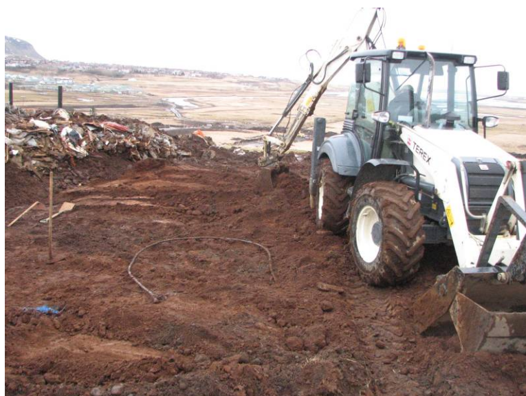
Mynd 5: Unnið að vélgræftri á Svæði C. SK12 er vinstra megin á myndinni Horft til vestsuðvesturs

Eftir að hafa litið á aðstæður í SK12 komst fulltrúi Fornleifaverndar ríkisins að þeirri niðurstöðu að óhætt væri að notast við skurðgröfu við að fletta yfirborðslögum af þeim hluta vegstæðisins sem liggur yfir bæjarhólinn. Áður en