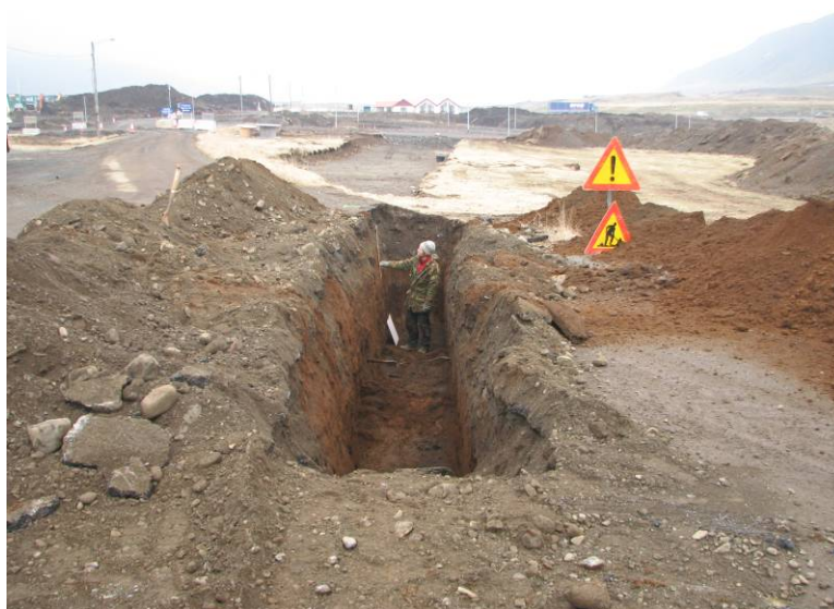
Mynd:4 Uggi Ævarsson að störfum í SK13. Horft til austurs

Upphaflega var það ætlun framkvæmdaaðila að leggja mikilvægar lagnir í vegstæðið sem liggja á um bæjarhólinn frá norðri til suðurs. Þegar í ljós kom að rannsóknir á þeim minjum sem sáust í SK-12 kynnu að hafa í för með sér