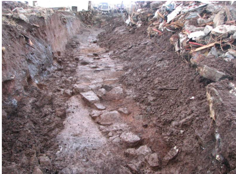
Mynd 3: SK12 að lokinni hreinsun. Vegghleðslurnar í vesturenda skurðarins eru í forgrunni fyrir miðri mynd

austnorðausturs (sjá Mynd 3). Náði hún um 4 m inn í skurðinn frá vesturenda, en þar myndaði hún 90° horn á mótum öðrum vegg sem lá til suðausturs og hvarf sá veggur undir ruðning fjóssins eftir um 1 m. Austan