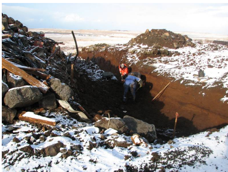
Mynd 2: Unnið að hreinsun á SK12 að loknum vélgræftri. Horft til vestnorðvesturs.

Eins og fram hefur komið var markmiðið upphaflega að hreinsa alveg upp grunn fjóssins og skrásetja allar minjar sem sæjust í botni hans, sem og sniðum. Vegna erfiðra aðstæðna reyndist ekki unnt að fjarlægja leifar fjóssins úr grunninum og því var brugðið á það ráð að grafa skurð