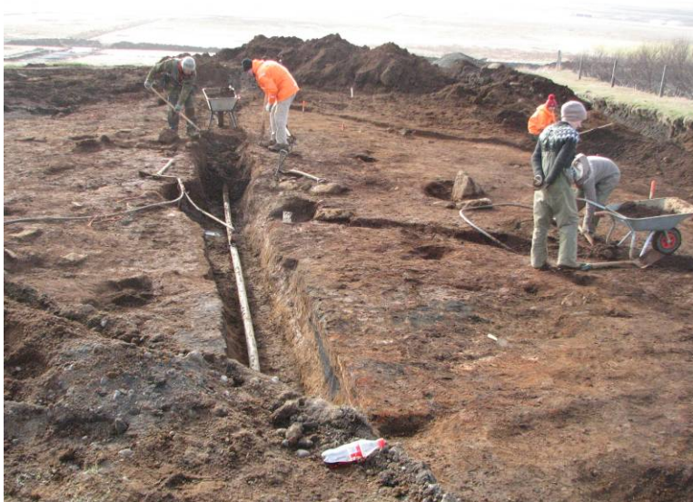
Mynd 6: Horft vestur eftir lagnaskurði sem liggur þvert í gegnum Svæði C