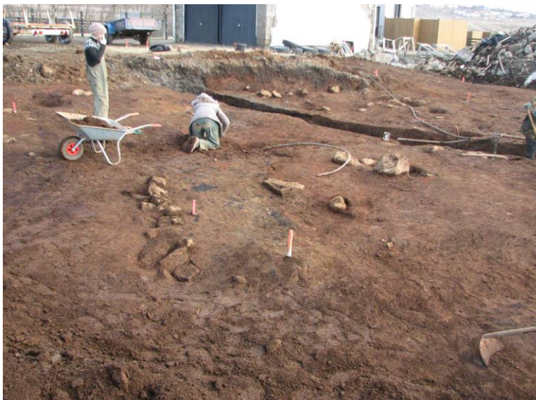
Mynd 7: Horft í austsuðaustur yfir norðvesturhluta uppgraftarsvæðisins. Grjóthlaðinn veggur er rétt vinstra megin við miðja mynd.

Þegar yfirborðslög höfðu verið fjarlægð af uppgraftarsvæðinu var komið niður á talsvert mikil og blönduð lög af litríku torfi blönduðu með blettum af viðar og móösku hér og þar. Mannvirki voru ekki greinileg í fyrstu, en eftir að svæðið hafði verið hreinsað upp fóru að koma í ljós mögulegar hleðslur úr torfi og grjóti vestan til á svæðinu. Auk þess kom í ljós mjög skýr grjóthlaðinn veggur norðvestan til á svæðinu sem í fljótu bragði virðist mögulega tengjast þeim mannvirkjum sem sáust í SK3. 3 Vatnslögn liggur gegnum mitt