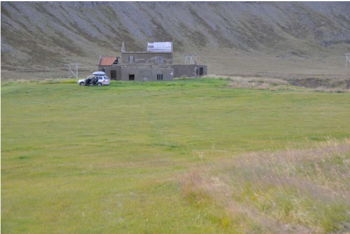
Mynd 7. Frá Belgsdal. Myndin er tekin í suðurjaðri túnsins og sjá má dæld fyrir miðri mynd, sem gæti mögulega verið þar sem vatnsleiðslan liggur.