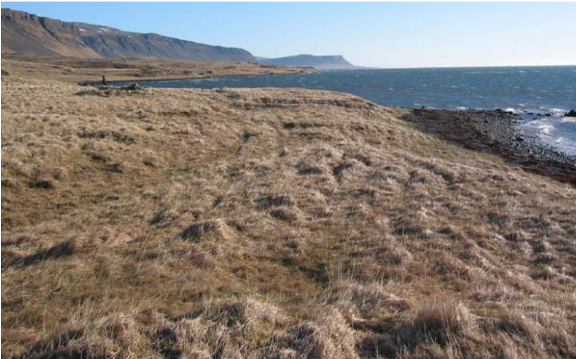
Mynd 3. Kumlateigur á Fagradalseyri.