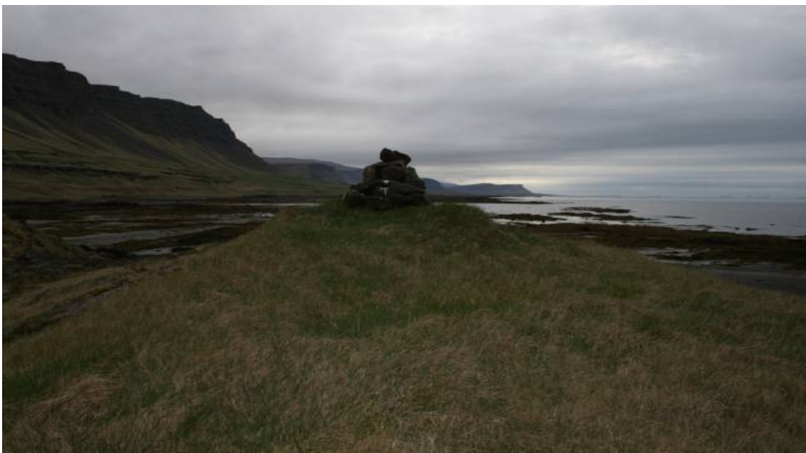
Mynd 4. Klapparhóll og ásetuþúfa með vörðubroti á Píngeyri í landi Tjaldaness.