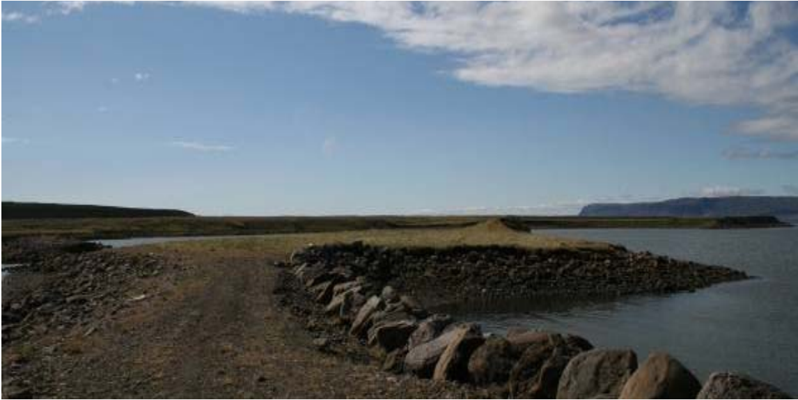
Mynd 5. Orrustuhólmi í Saurbæ