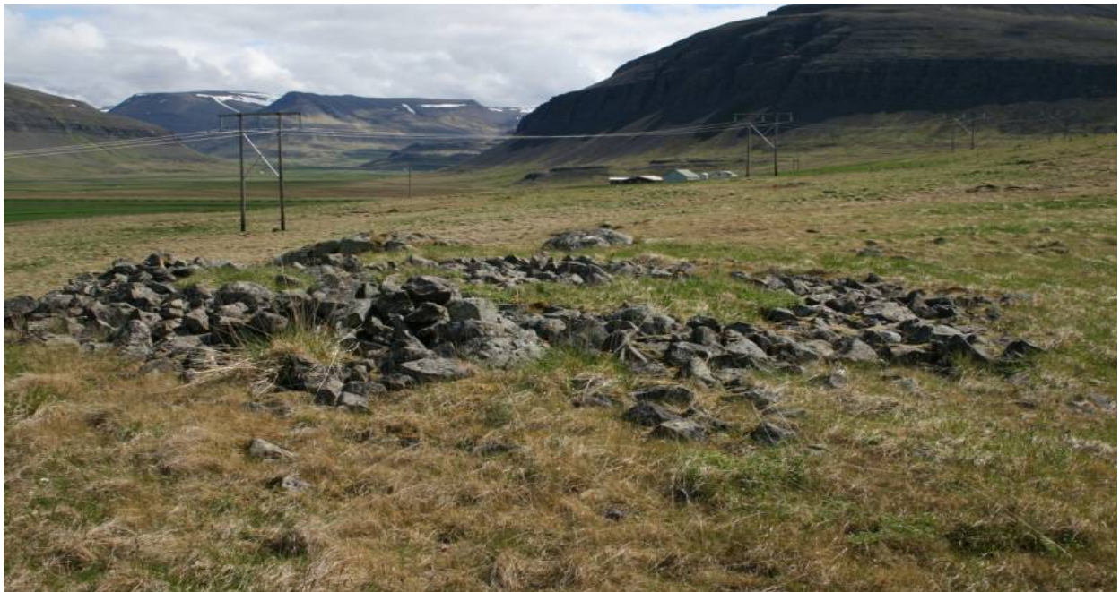
Mynd 6. Náttúruleg grjótdys í landi Stóra-Múla í Saurbæ.

Grjótdys er í gróinni brekku ofan vegar, um 200 í SV frá Stóra-Múlubæ. Talin geta verið legstaður, en líkist náttúrulegri dys.